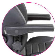
Flip-Up Arm inkl. Höhenverstellung