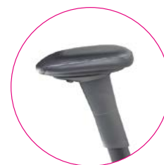
XL Multi Armlehne