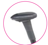
XL Multi Armlehne